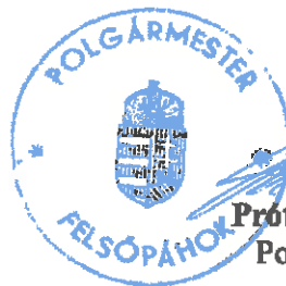
Prótár Richárd Krisztián Polgármester